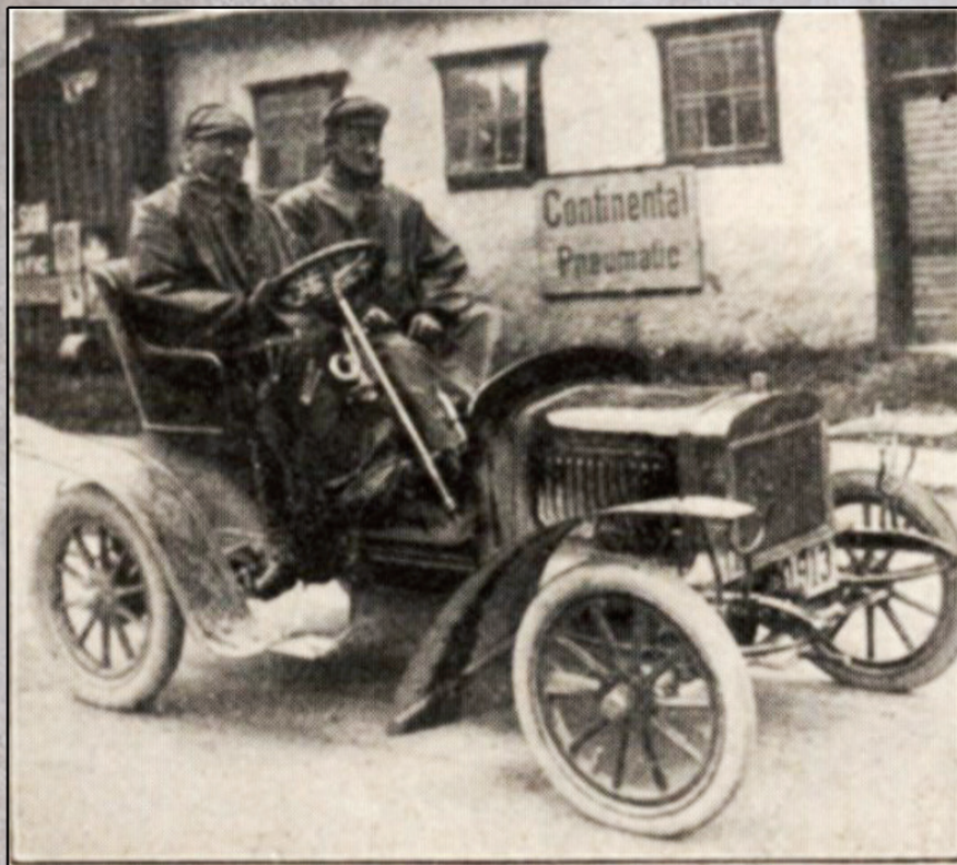
Karl Slevogt Sieger am Semmering 1906 auf Laurin&Klement Voiturette A